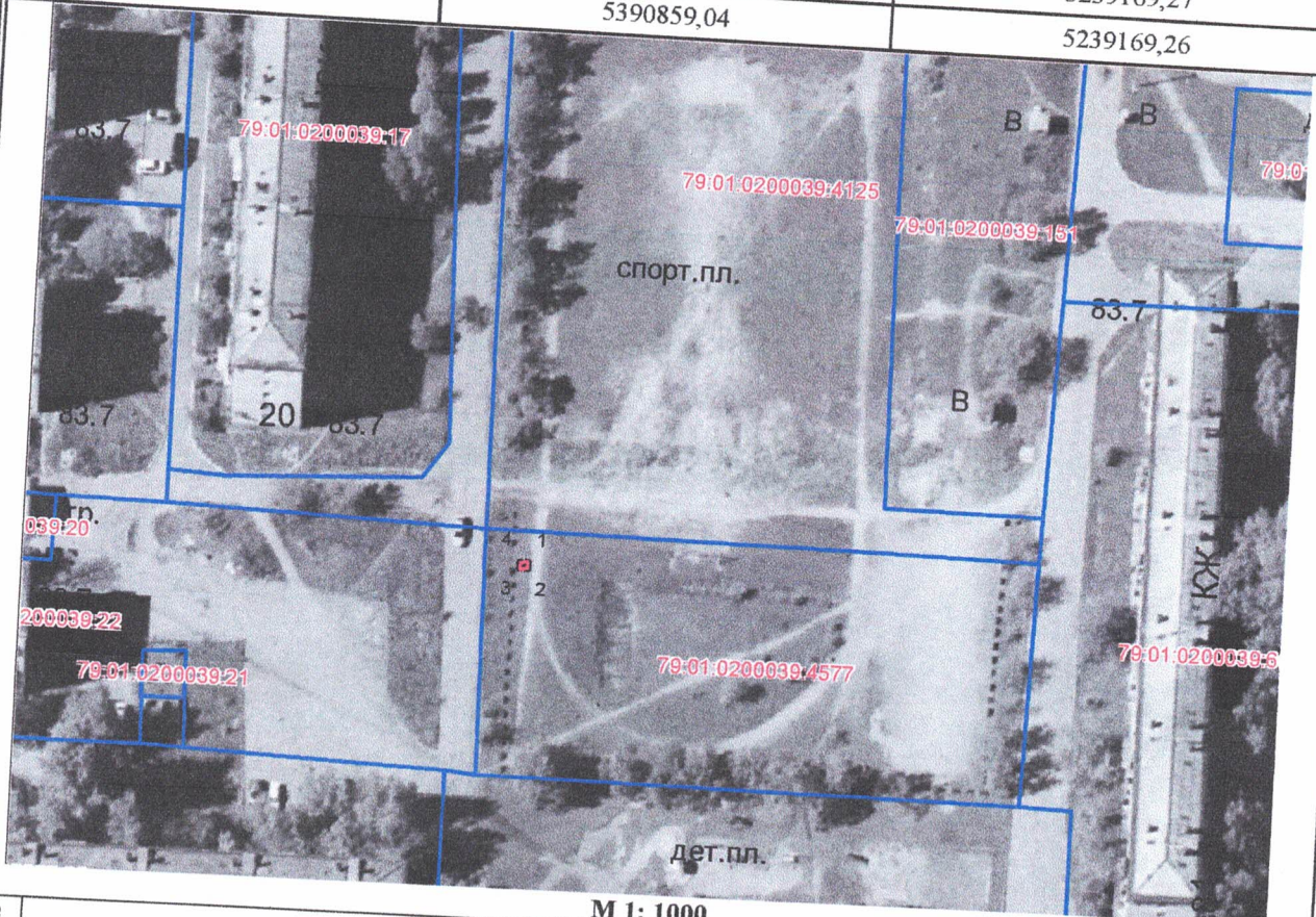
М 1: 1000